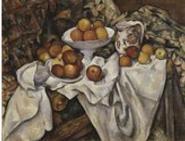
Paul Cézanne: Nature morte aux pommes et aux oranges- Musée d'Orsay- 1899 (?)

Et, pour la bonne bouche finale... on ne peut oublier les pommes promues objets d'art par Cézanne!