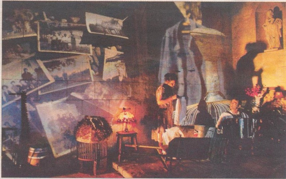
Des sensations, une ambiance... « Insos etc. » conte la vie d'antan d'un quartier d'une façon très originale.

La présentation du 19 septembre à l'église d'Insos du projet « Insos in Situ » a suscité un tel intérêt auprès du public présent, qu'il est apparu comme une évidence, autant pour ceux qui connaissent le quartier, que pour ceux qui le découvraient, que ce travail dépassait l'expérience locale et devait être un spectacle à part entière. C'est ainsi qu'« insos in situ » est devenu « Insos etc. »