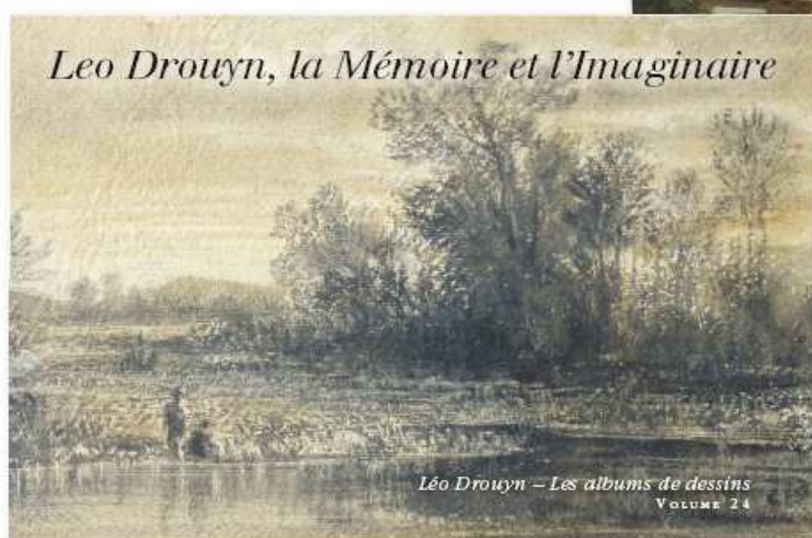
Leo Drouyn, la Mémoire et l'Imaginaire (vol. 24)