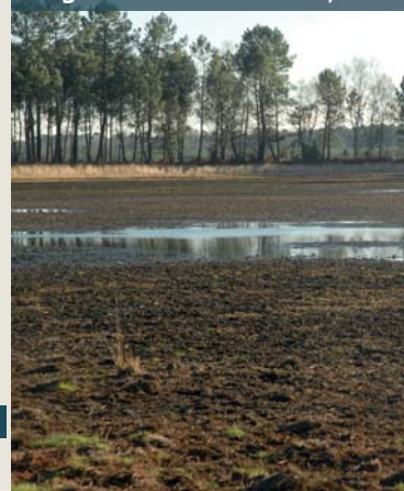
Lagune de la Roustouse, source

L'histoire des forêts de la vallée du Ciron est atypique pour la région. Durant la dernière glaciation, alors que des arbres sont plutôt dispersés dans le sud de la Péninsule ibérique, de l'Italie, des Balkans et en Turquie, une forêt est bien présente en vallée du Ciron. Il s'agit probablement de peuplements de pin sylvestre, bouleau et hêtre qui subsistent dans les gorges du Ciron. Malgré la déforestation de la région, les cartes de Belleyrne de 1785 attestent la persistance de cette forêt. Cette longue histoire forestière, combinée à l'hétérogénéité du milieu, explique la richesse des lieux et leur confère un caractère exceptionnel. Un peuplement de hêtres est présent dans le secteur des gorges du